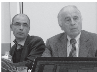
Les historiens Antoine Prost, président du Conseil scientifique (à droite), professeur émérite à La Sorbonne, et Olivier Wieworka, membre du Conseil, professeur à l'ENS Cachan.

Dotée d'un fonds patrimonial historique exceptionnel de plus de trois millions de volumes et d'environ un million et demi de documents iconographiques, la BDIC entretient, depuis ses origines, des relations étroites avec le monde de la recherche en histoire contemporaine et relations internationales : en France, elle constitue, aujourd'hui, l'un des gisements majeurs pour ces domaines.