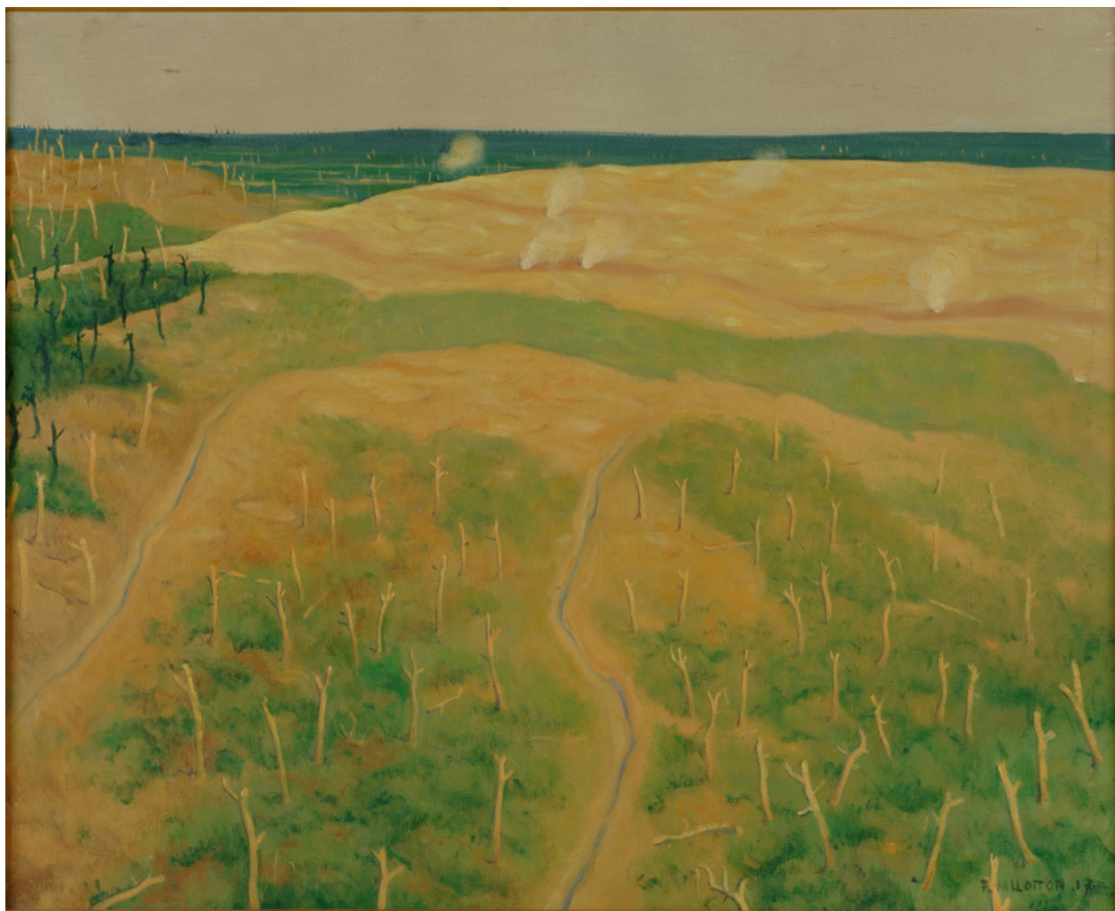
Félix Vallotton, Tirs sur Bolente , 1917. Huile sur toile. Coll. BDIC

Co-produite par la BDIC et le Musée de l'Armée, l'exposition Vu du front : représenter la guerre s'intéressera à la manière dont les contemporains de l'évènement ont perçu et représenté le front en France et en Europe. Réunissant plus de 300 pièces (œuvres d'art, documents d'archives, objets, photographies, films) elle se tiendra aux Invalides, à Paris, du 15 octobre 2014 au 30 janvier 2015.