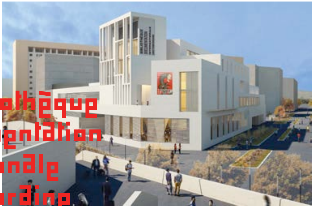
Le projet de l'Atelier Bruno Gaudin. Vue du cours Nicole Dreyfus. ©IDEA