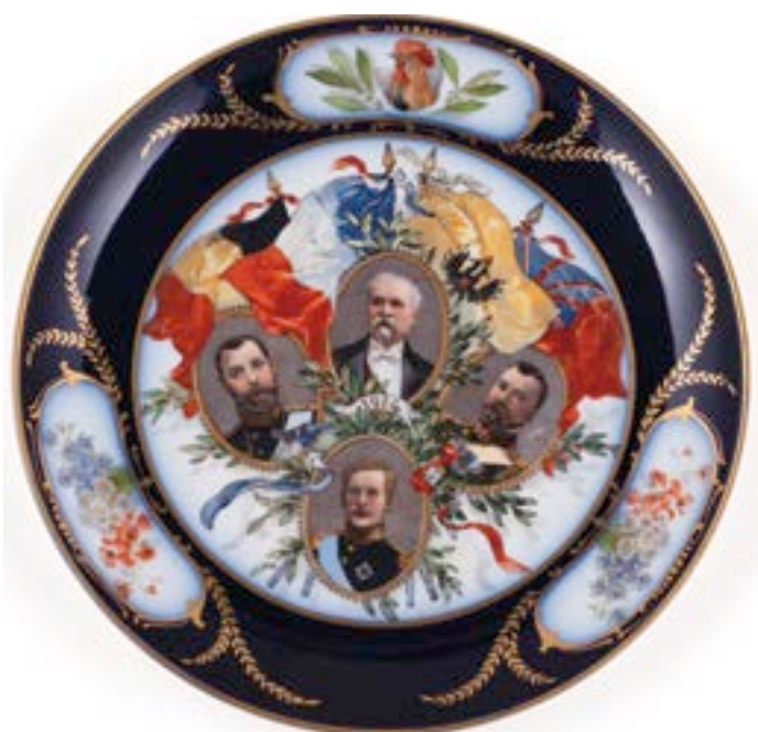
10. Assiette décorative (1914 – 1918)

L'exposition Et 1917 devient Révolution , soutenue par le Département des Hauts-de-Seine (prêt des Archives départementales émanant de la Bibliothèque d'histoire sociale-La Souvarine), illustre la volonté de la collectivité de permettre au plus grand nombre d'accéder facilement à un patrimoine culturel et historique exceptionnel.