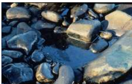
Pollution de l'Exxon Valdez, Alaska