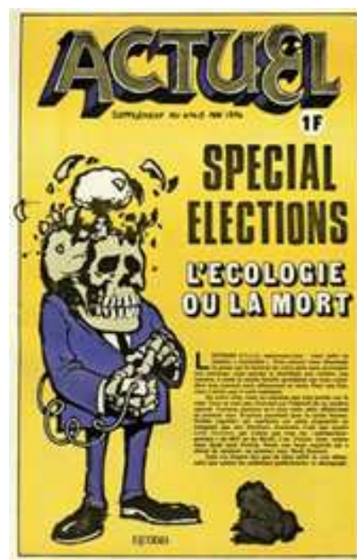
Actuel, Spécial élections avril 1974.