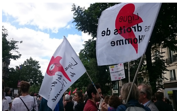
MARCHE SOLIDAIRE DU 17 JUIN 2018

La contemporaine a pour mission de collecter, conserver et communiquer des collections sur l'histoire des mondes contemporains aux XX e et XXI e siècles. Dès sa création durant la Grande Guerre, elle rassemble, prioritairement en langue originale, des documents de toute nature, pouvant servir à interpréter et écrire l'histoire du temps présent. Aujourd'hui, elle propose à la consultation plus de 4,5 millions de documents, dont 150 000 sont disponibles dans sa bibliothèque numérique, l' Argonnaute .