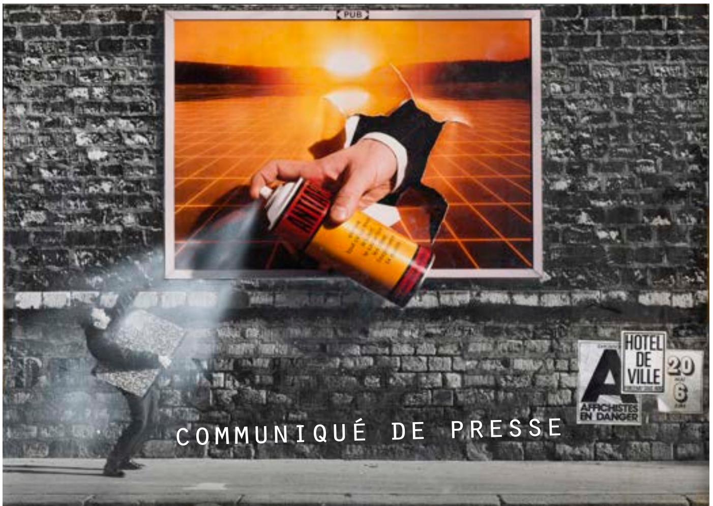
1. Affiche 1992, 116 x 155 cm.